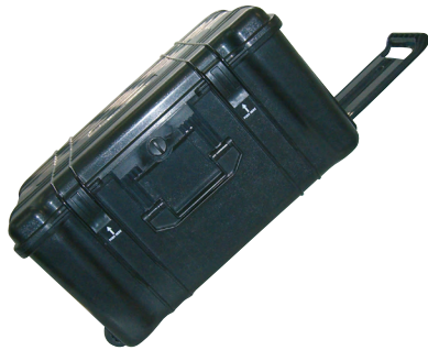
Maleta de transporte robusta

La maleta de transporte robusta de plástico negro con asas, tapa y otra asa extensible.