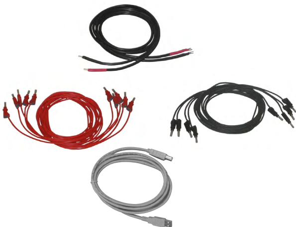
T 1000 PLUS - Kit estandar de cables

El kit incluye cables para cualquier tipo de conexionado.