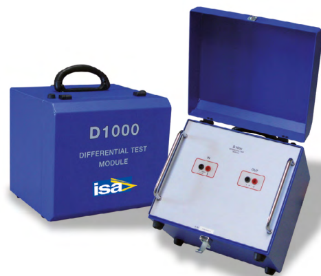
D 1000 modelo diferencial para ensayo de relés