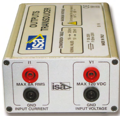
Módulo convertidor de salida

Las partes pueden ordenarse separadamente, el conectado de salida solo o también el cable o ambas.